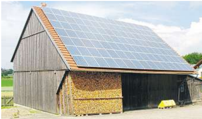
Gerade Scheunen oder gewerbliche Gebäude eignen sich meist hervorragend für Photovoltaikanlagen.