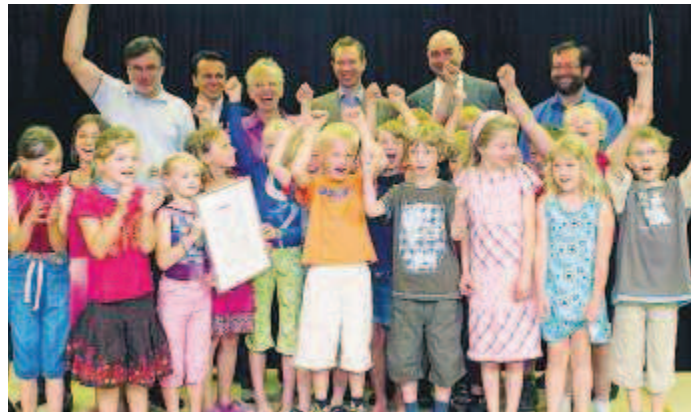
Großer Jubel bei der zweiten Klasse der Pettendorfer Grundschule, den ersten Gewinnern des Enerix Umweltpreises 2009.

Regensburg. Die Verleihung des ersten Enerix Umweltpreises ist noch in guter Erinnerung. Am 17. Juli jubelten die Kinder der Pettendorfer Grundschule. Die 2. Klasse hatte mit ihrem Projekt „CO 2 -Pass“ den ersten Preis